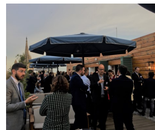
Ultimo encuentro informal de las Cámaras Europeas en Barcelona

Esperamos que vayáis a buscar y conectar con el Círculo Danés en LinkedIn.