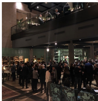
Las Cámaras Europeas en Hotel H10 Marina.

Se suele organizar los encuentros informales tres veces al año y por