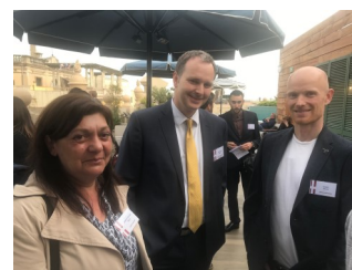
Las Cámaras Europeas en Hotel H10 Madison

Coinciden en lo que nos comentan los participantes en general, que son encuentros idóneos para el networking internacional por su formato informal y empresarial y